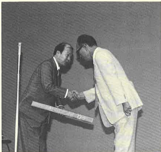
▲ 台湾小児保健協会長より 会頭へ記念品贈呈