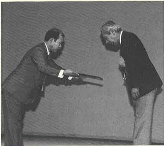
▲ 会 頭 表 彰