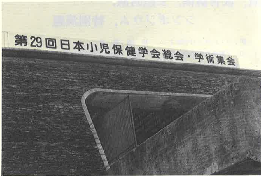
◀ 主会场 (那覇市民会館)