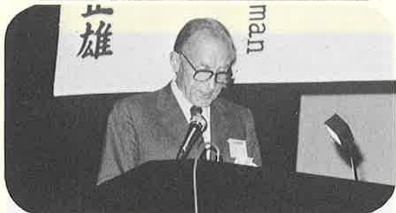
◀ 特別演題 (二〇・ホルマン)