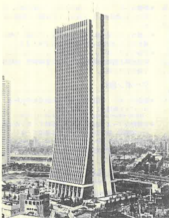
— 安田火災海上本社ビル —